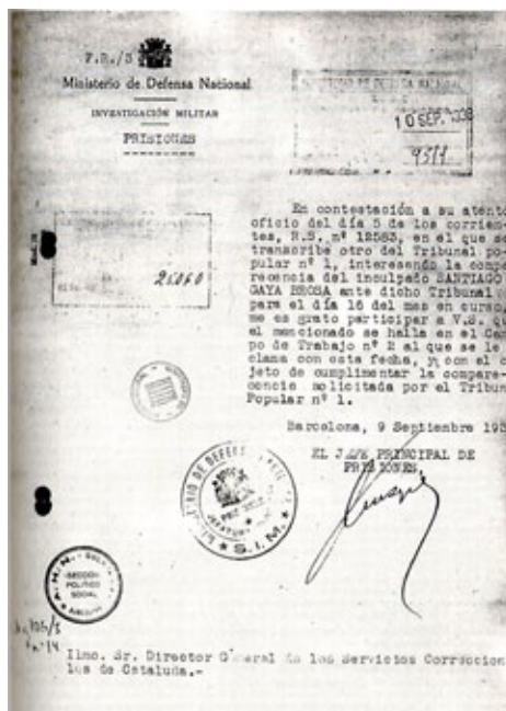
Document on el Tribunal Popular núm. 1 reclama la presència d'un presoner localitzat al camp de treball núm. 2.

dels Xacano a la plaça de la Marina i d'altres com la dels Loscos al carrer César Gimeno. Els presos hagueren de fer ells mateixos uns forats a terra, sense sostre, on pernoctar en grups de 3 o 4 persones. Temps després es cobriren amb branques i es construïren barracons. Aviat s'imposà el terror al camp. Les primeres nits els vigilants tragueren uns presos del clot i els assassinaren després de cavar la seva pròpia tomba. El dia 26 d'abril foren afusellats al cementeri de l'Hospitalet (el que estava al col·legi Mestral) quatre militars (coneixem el nom de N. Bartolomé) i els sacerdots Antonio Alamán Marco, Manuel Martín Hinojosa i Marcelino Jimeno Vicente.