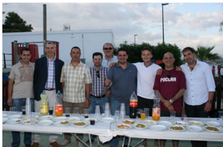
Membres de l'organització de la festa.