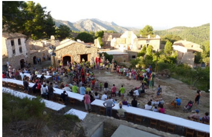
Cercavila pels carrers.