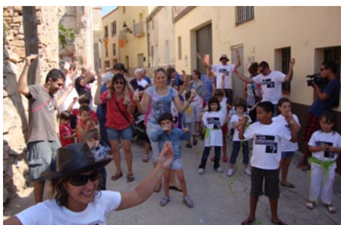
Cercavila infantil 'Terramar'.