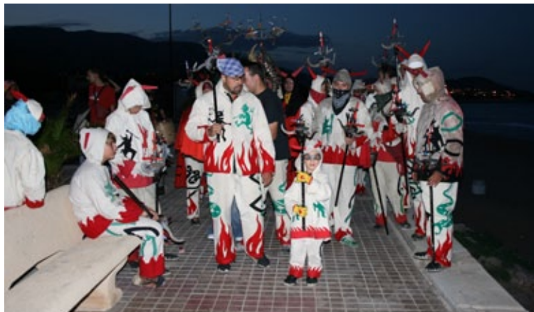
Espectacle de foc amb els Diablers de Vandellòs.