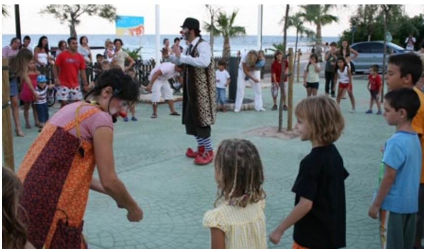
Tarda d'animació infantil.