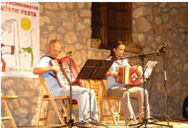
Trobada d'acordionistes.