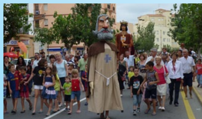
Cercavila posterior al pregó.