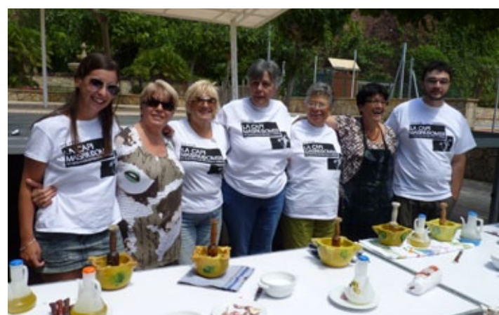
Participants del concurs d'allioli.