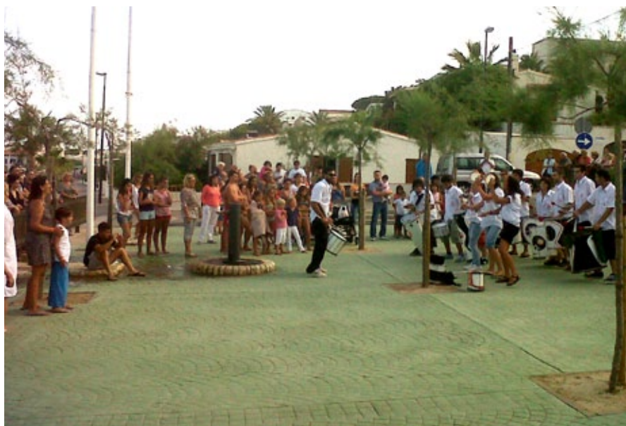
VallSamba pels carrers.