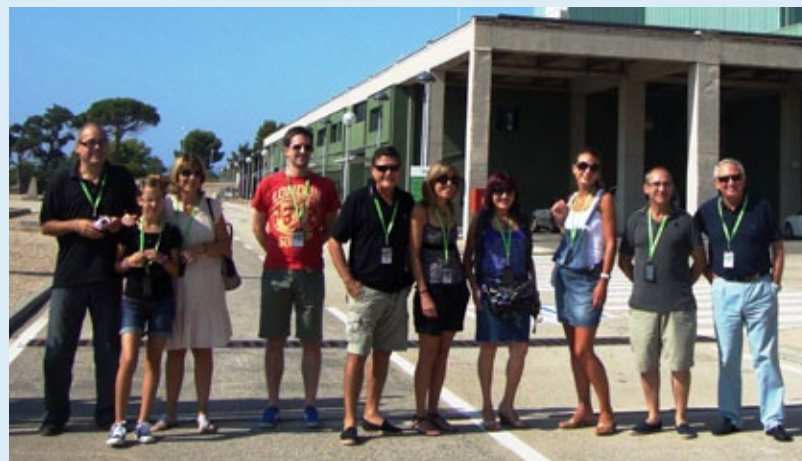
Familiars de treballadors del CT Mestral visiten durant l'agost el Mestral.

A banda dels turistes, durant els mesos d'estiu grups de familiars i amics dels treballadors del CT Mestral aprofiten per visitar les instal·lacions.