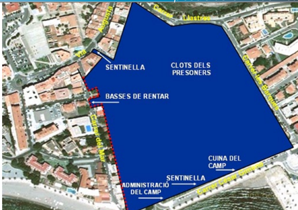
Plànol de Vicente Marzo. Les línies vermelles corresponen al mur de filferro aixecat; i el remarcat blau, a la zona ocupada pel camp.