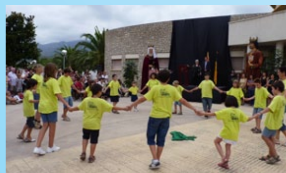
El grup de sardanes del Foment Cultural va ballar per la pregonera.