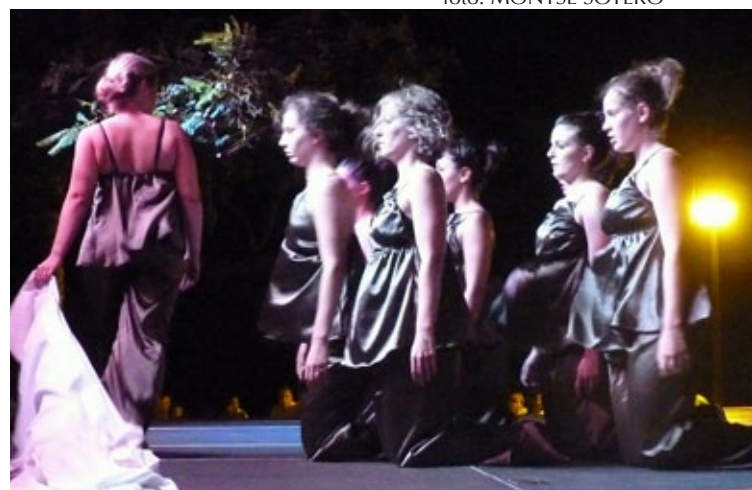
Dansa vora la mar blava.