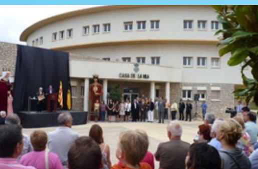
Uns parlaments molt emotius van donar inici a la festa.