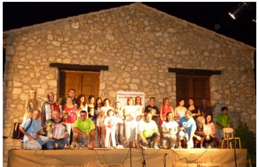
Participants de la trobada d'acordionistes.