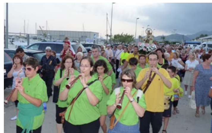
Processó de la Verge del Carme.