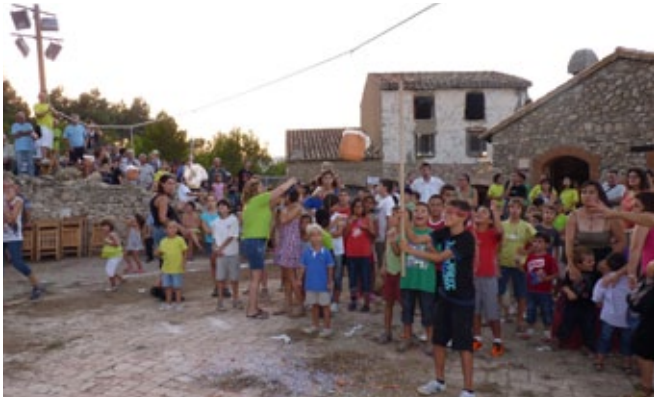
Cucanyes i jocs tradicionals.