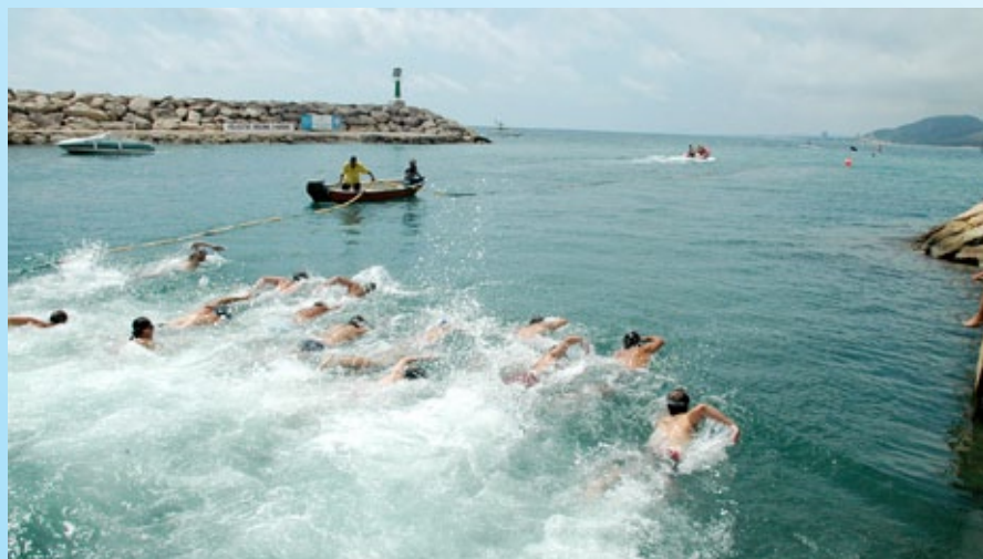
Travessa al port nedant.