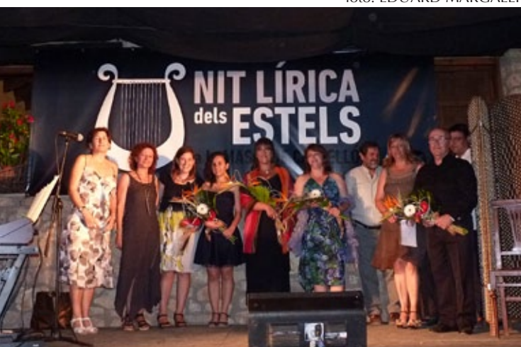
Nit lírica dels estels.