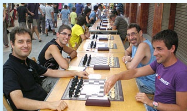
V Escacs Llampec.