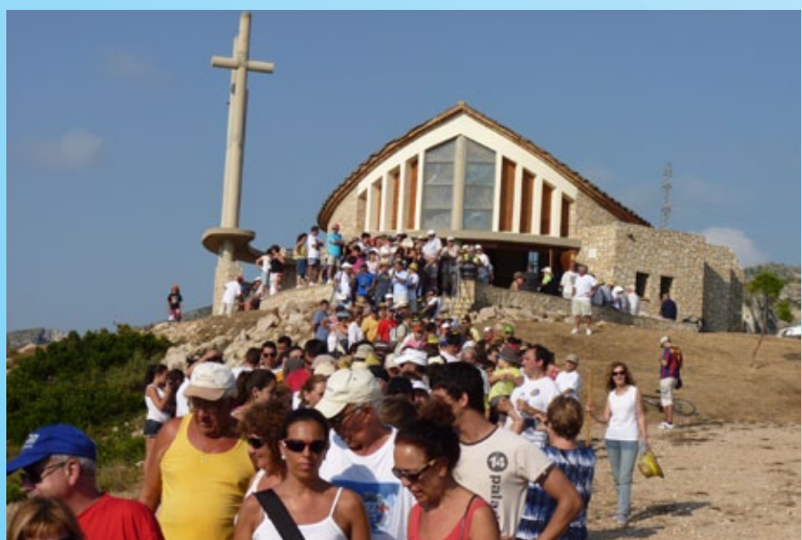
Pujada a l'Ermida de Sant Roc.