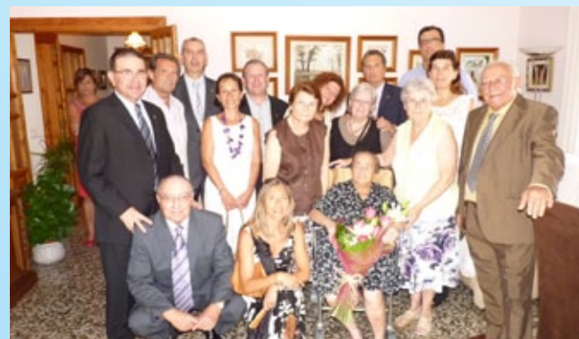
Homenatge a la dona més gran.