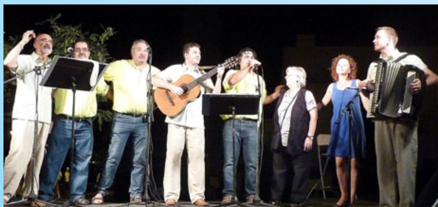
Havaneres amb els grups l'Espingari i Vent Fort.