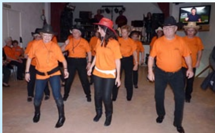
Exhibició de country.