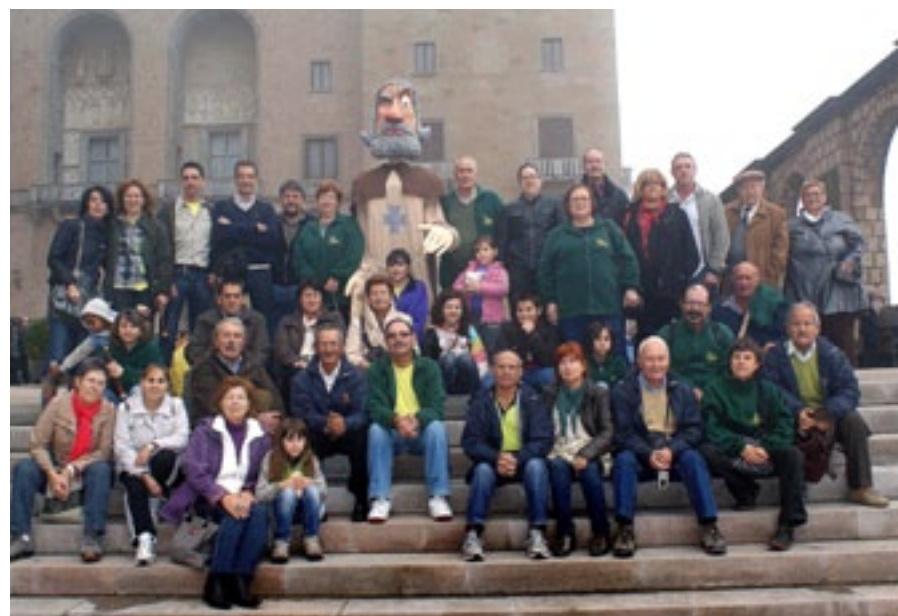
Sortida a Montserrat de les colles del Foment Cultural