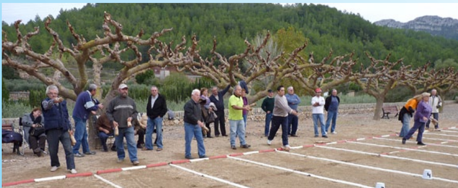
XXII Tirada lliure de bitlles.