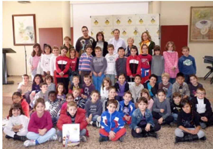
Visita dels alumnes de 2on de l'Escola Mestral a la Casa de la Vila de l'Hospitalet