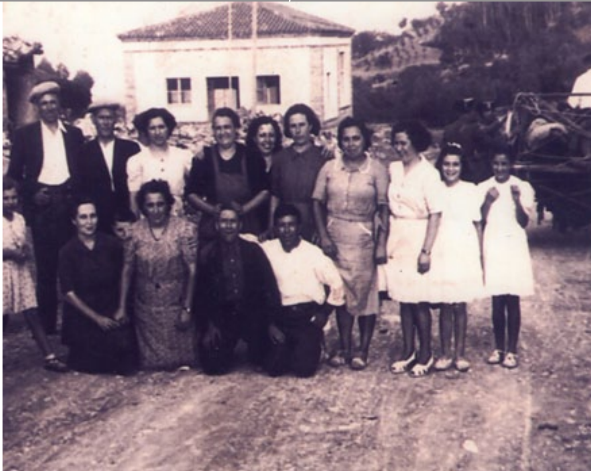
Veïns de Masriudoms davant de l'escola. Any 1940.