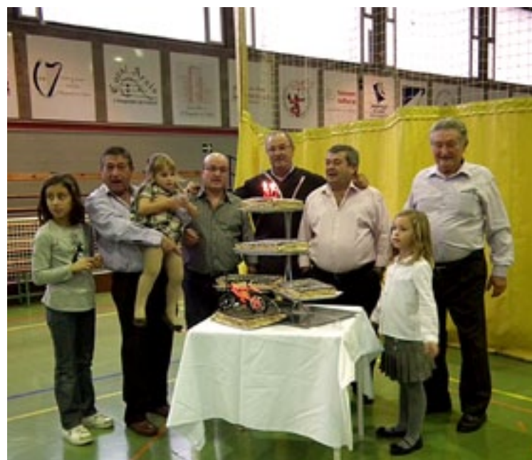
Celebració del 30è aniversari de la Penya Ciclista de l'Hospitalet.