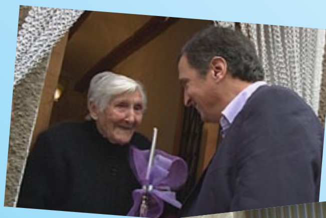
Lliurament d'obsequis a la gent gran