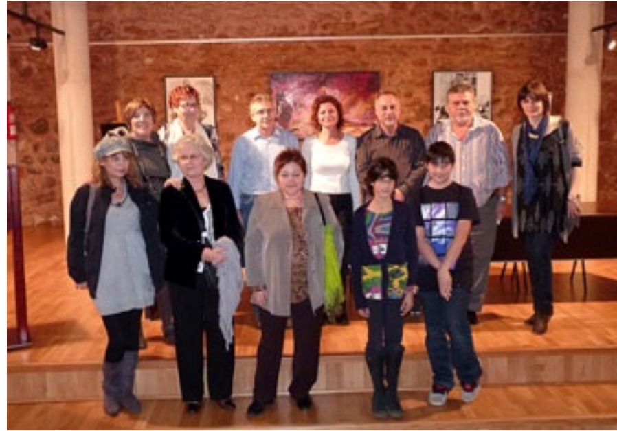
Inauguració de l'exposició "A flor de pell", del Taller Art i Quadre.