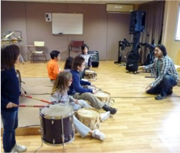
Curset de tabal per a infants, a l'Escola Municipal de Música.