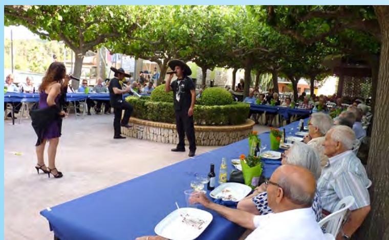
Homenatge a la gent gran.