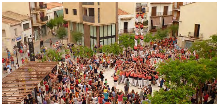
Actuació castellera de la Colla Vella dels Xiquets de Valls.