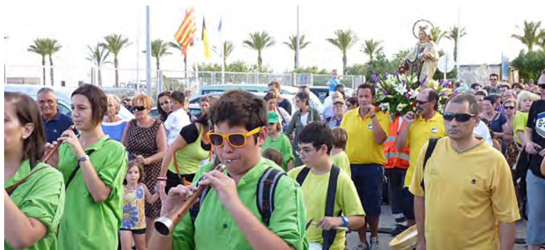
Processó per la celebració de la Verge del Carme.