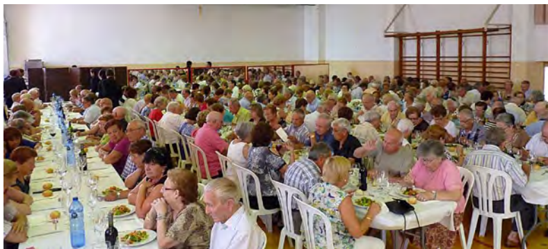
Dinar organitzat pel Casal d'avis de l'Hospitalet.