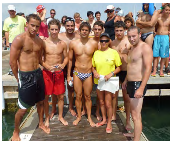
Travessia al port nedant.