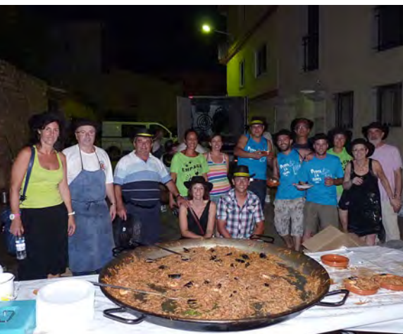
Fideuà popular.