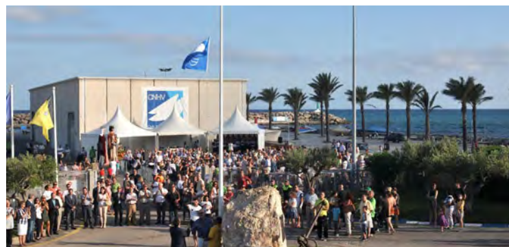
Hissada de la Bandera Blava al port esportiu.