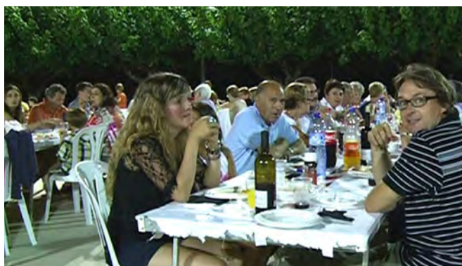
Sopar d'estiu de Masboquera.