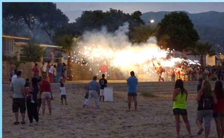
Espectacle de foc dels Diablers de Vandellòs.