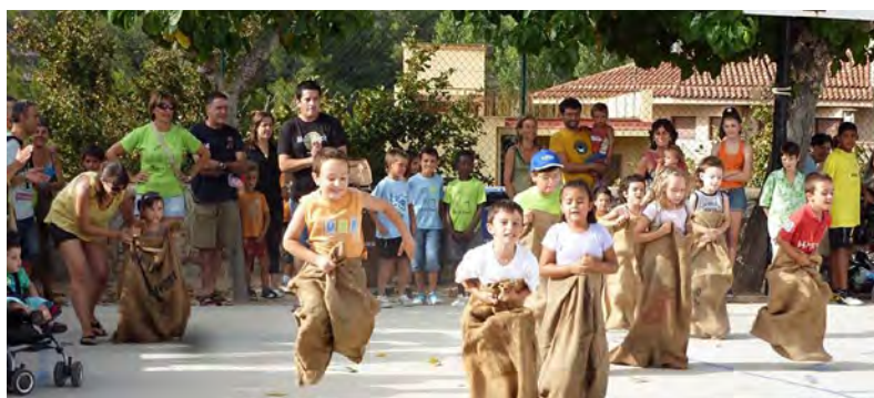
XIV Rústic Festa.