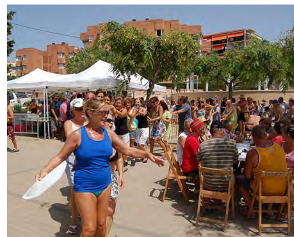
Vermut popular.