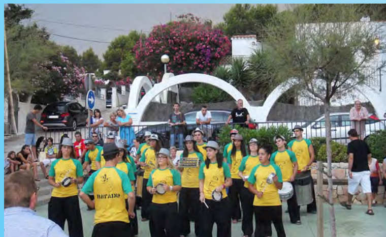
Actuació de Batadip Batucada.