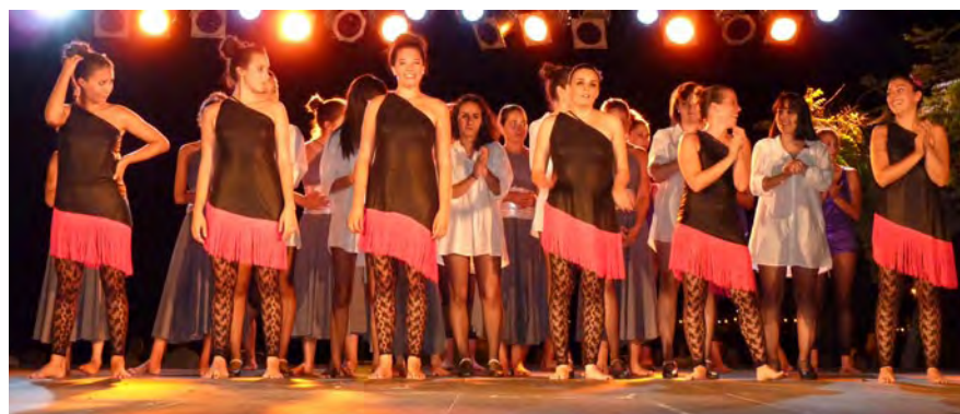
Dansa vora la mar blava.