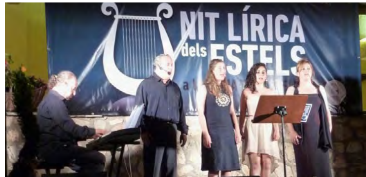
II Nit Lírica dels Estels.