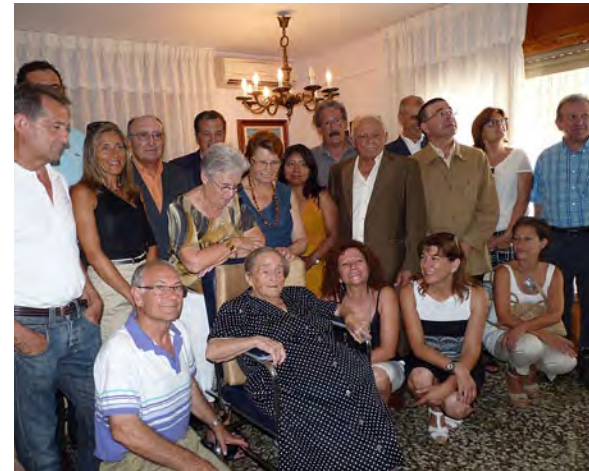
Homenatge a l'àvia més gran.