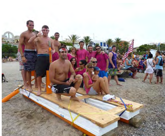
V competició resistència de barques.