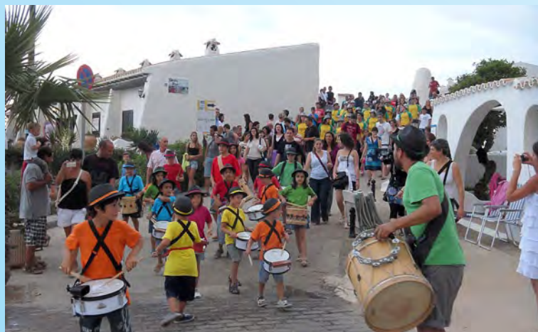
Actuació dels Batukets.