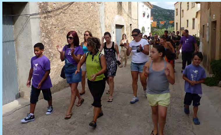
Cercavila pels carrers.