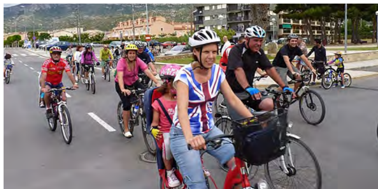
Bicicletada popular.