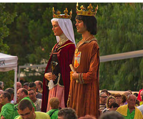
Trobada de gegants.