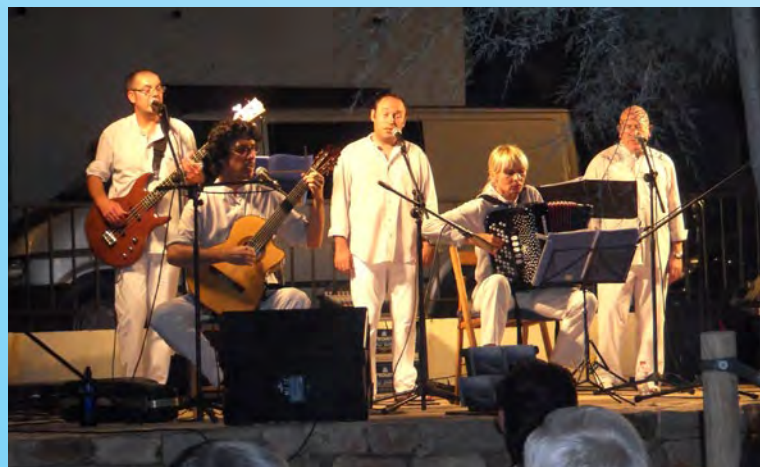
Cantada d'havaneres a càrrec de Veus de Reus.