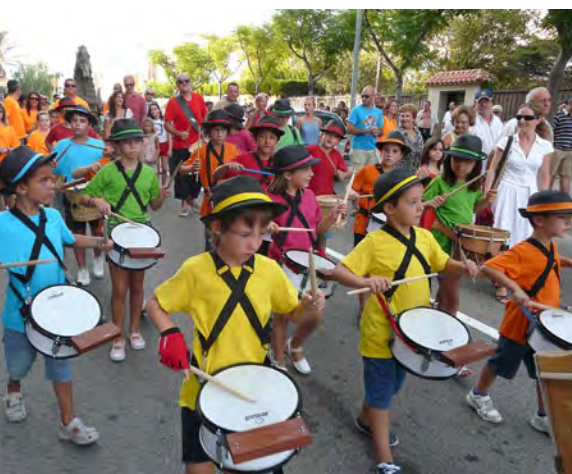
Cercavila posterior al pregó.