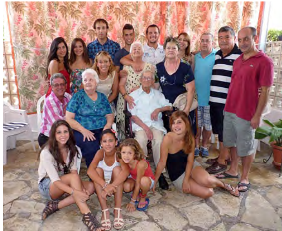
Homenatge a l'avi més gran.