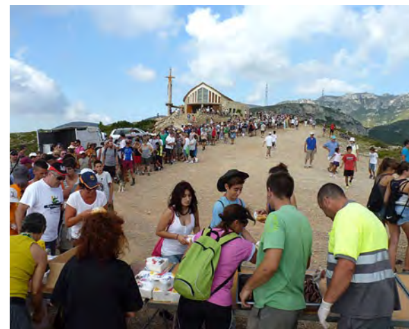
Pujada a peu a l'ermita de Sant Roc.