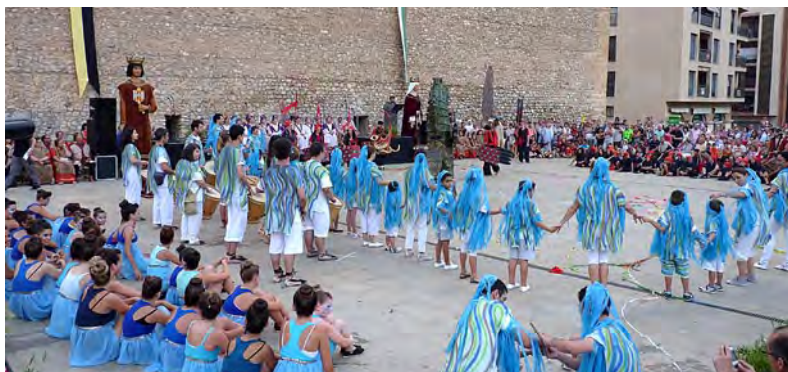
Representació d'Un Mar Vivent.