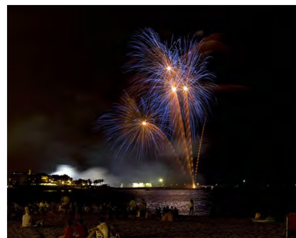
Gran castell de focs.