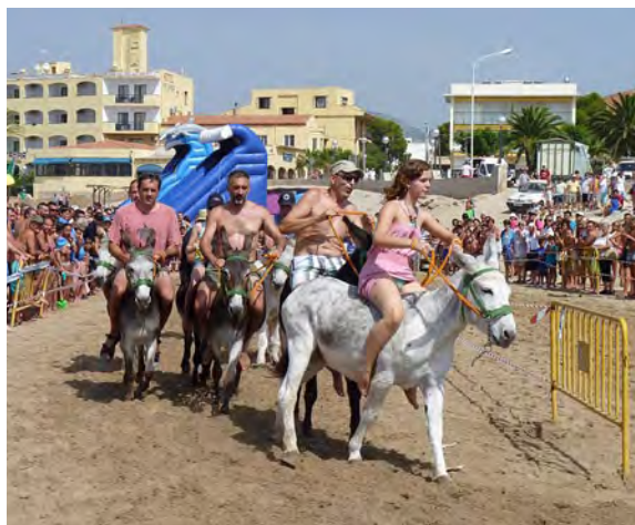
Cursa de rucs.