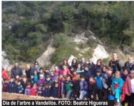
Dia de l'arbre a Vandellòs.