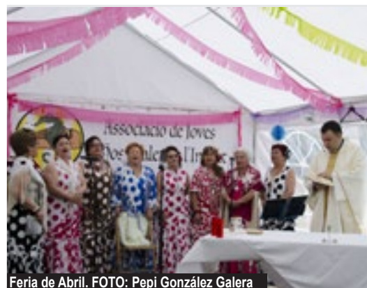
Feria de Abril.