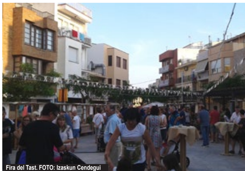
Fira del Tast.