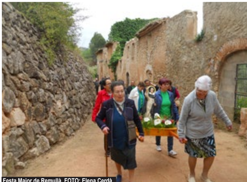
Festa Major de Remullà.