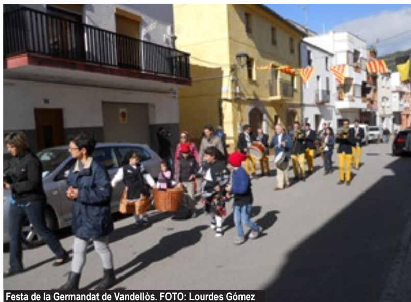
Festa de la Germandat de Vandellòs.