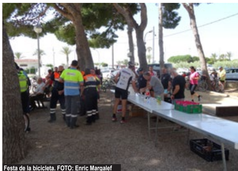
Festa de la bicicleta.