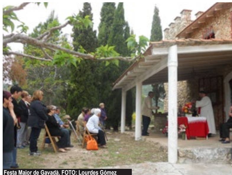
Festa Major de Gavada.