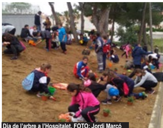
Dia de l'arbre a l'Hospitalet.