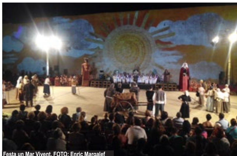
Festa un Mar Vivent.