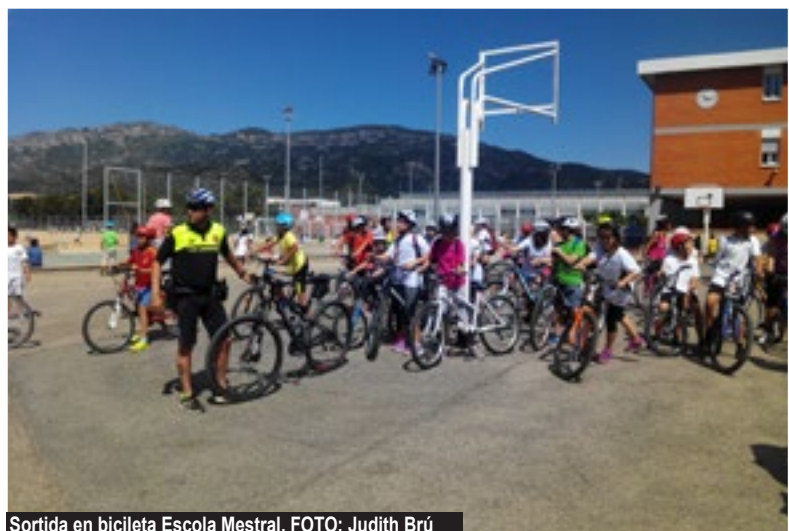
Sortida en bicicleta Escola Mestral.