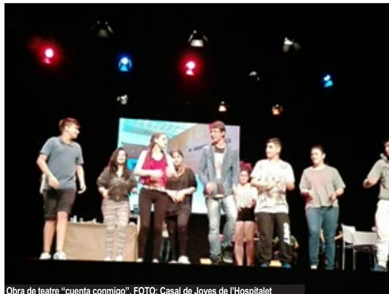
Obra de teatre "cuenta conmigo".