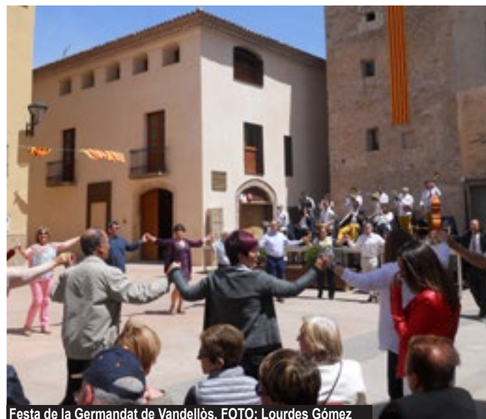
Festa de la Germandat de Vandellòs.