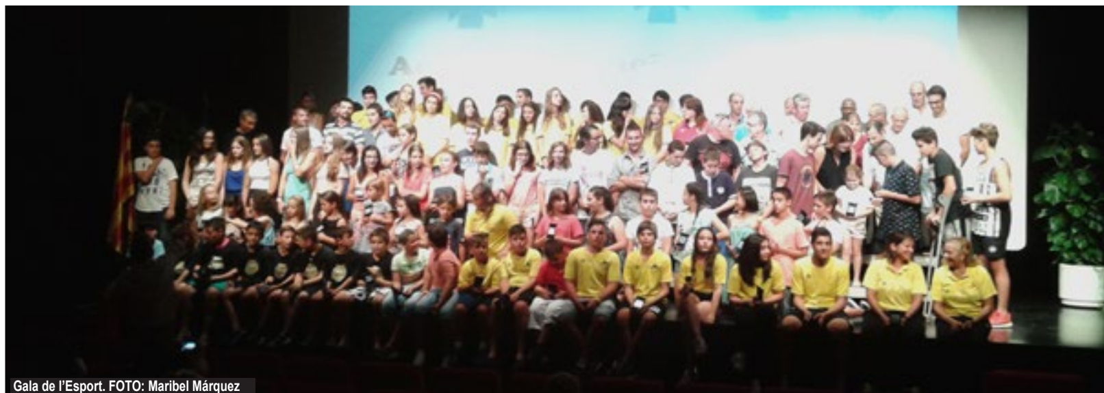
Gala de l'Esport.