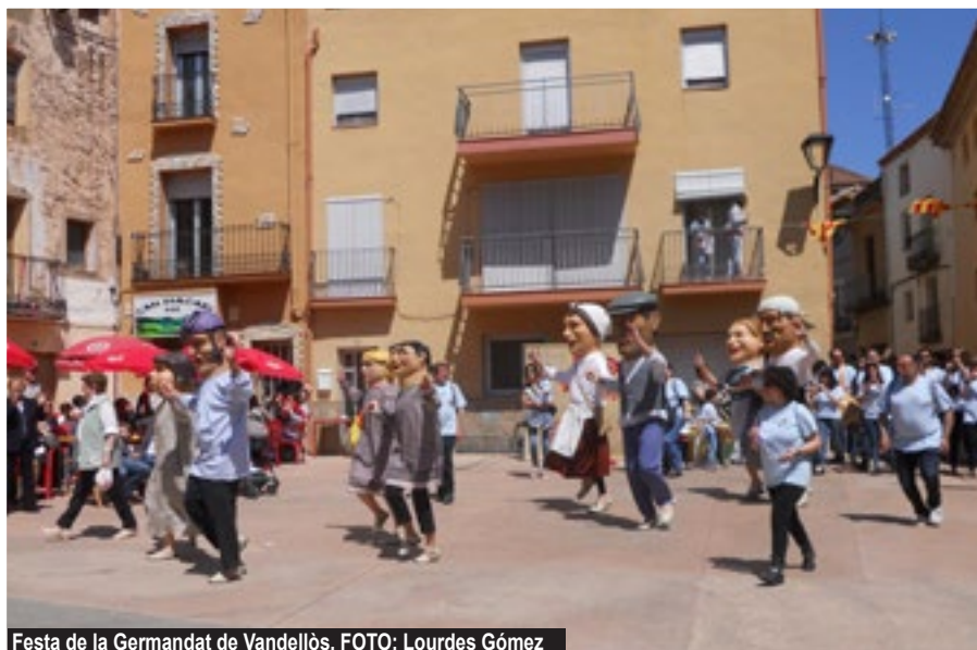
Festa de la Germandat de Vandellòs.