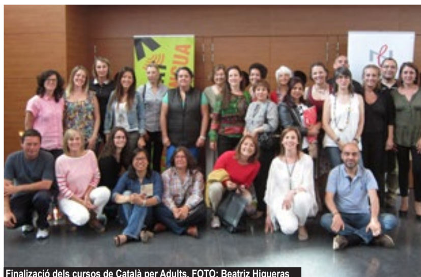
Finalizació dels cursos de Català per Adults.