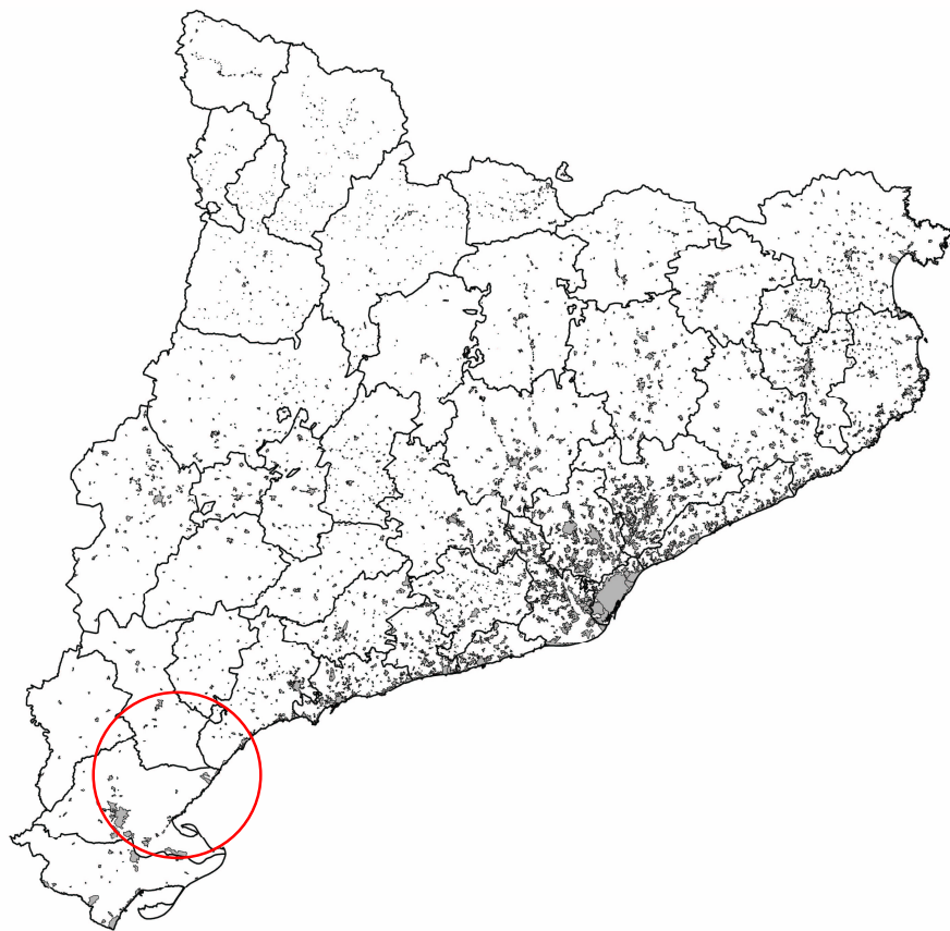
Fig_01: Superfície urbanitzada de Catalunya. El sector de les muntanyes de Tivissa i Vandellòs són una de les majors àrees de caràcter netament natural i amb menor ocupació (antròpica de Catalunya).

D'altra banda, atès que aquestes muntanyes representen la confluència (enfonsament) de la serralada Prelitoral Catalana i la Mar (fenomen que només es dona en aquest punt geogràfic de Catalunya), mostren complexos paisatges de lluminositat, cromatismes i abruptesa únics i singulars en la façana litoral d'aquest territori. Alhora, el paisatge resultant, dominat per màquies austromediterrànies, no deixa de ser altament representatiu de la Catalunya meridional. Aquest fet, juntament amb la seva entitat física i geogràfica, el seu alt grau de naturalitat, i d'altres aspectes ja esmentats al llarg de la diagnosi (àrea estratègica per a la conservació de les comunitats de rapinyaires rupícoles – de roquissars – de la muntanyes baixa i mitja mediterrània així com per a d'altres espècies vertebrades, àrea de singular transició hidrogeològica, etc.), obliguen a identificar aquest espai com un dels paisatges relictuals que són cabdals per a la futura estratègia catalana de conservació del paisatge i de la biodiversitat i la funcionalitat ecològica.