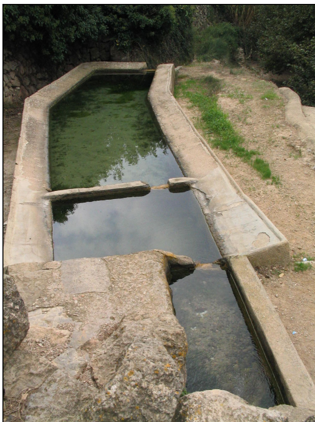
Fotografia 7. Font i rentador prop de Remullà