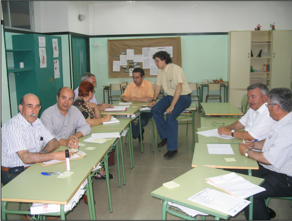
Fotografia 39. Tallers de Diagnosi. Grup dels agents Polítics.