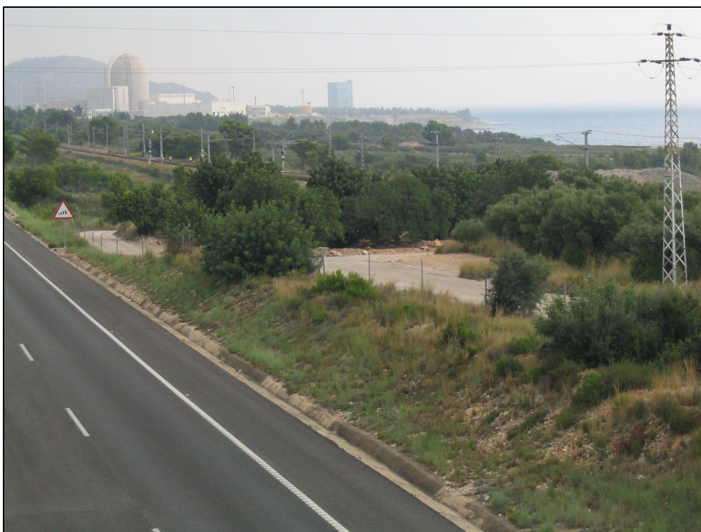
Fotografia 19. Impacte de l'efecte acumulatiu de les infraestructures implantades a la façana litoral (centrals Nuclears, autopista i via del tren).