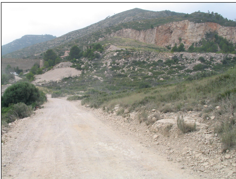
Fotografia 29. Impacte d'una pedrera abandonada a l'interior de l'Espai d'Interès Natural del Torn-les Rojales. S'ha d'elaborar de forma prioritària un projecte de restauració ambiental i d'ordenació de l'ús públic d'aquesta zona.