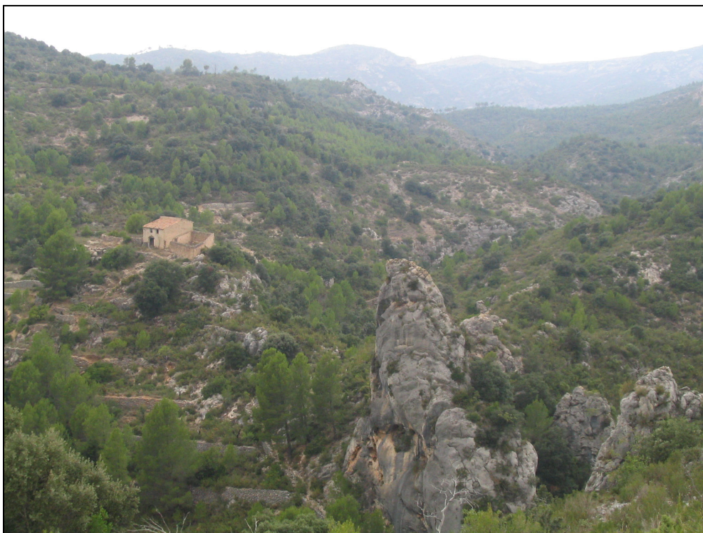
Fotografia 15. Corral al barranc de l'Abellar.