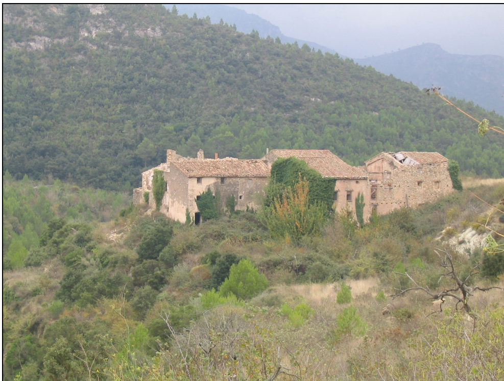
Fotografia 28. Gavadà (nucli abandonat). Cal incentivar la recuperació d'aquests nuclis.