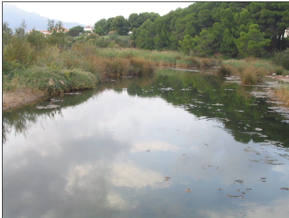
Fotografia 33. Zona humida de la desembocadura del riu Llastres. L'existència del fartet ( Lebias ibera ), peix endèmic protegit, confereix a aquesta llacuna litoral un gran valor de conservació.