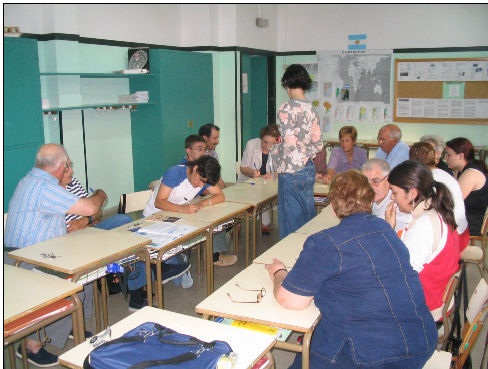
Fotografia 41. Tallers de Diagnosi. Grup dels agents Socials.