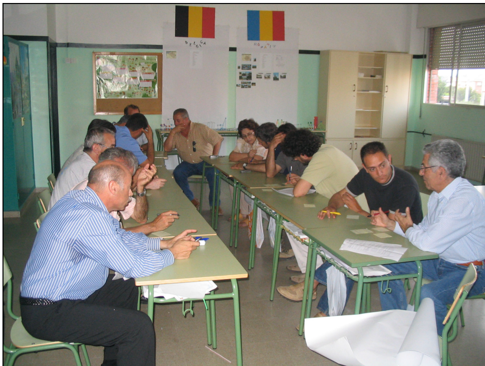
Fotografia 40. Tallers de Diagnosi. Grup dels agents Econòmics.