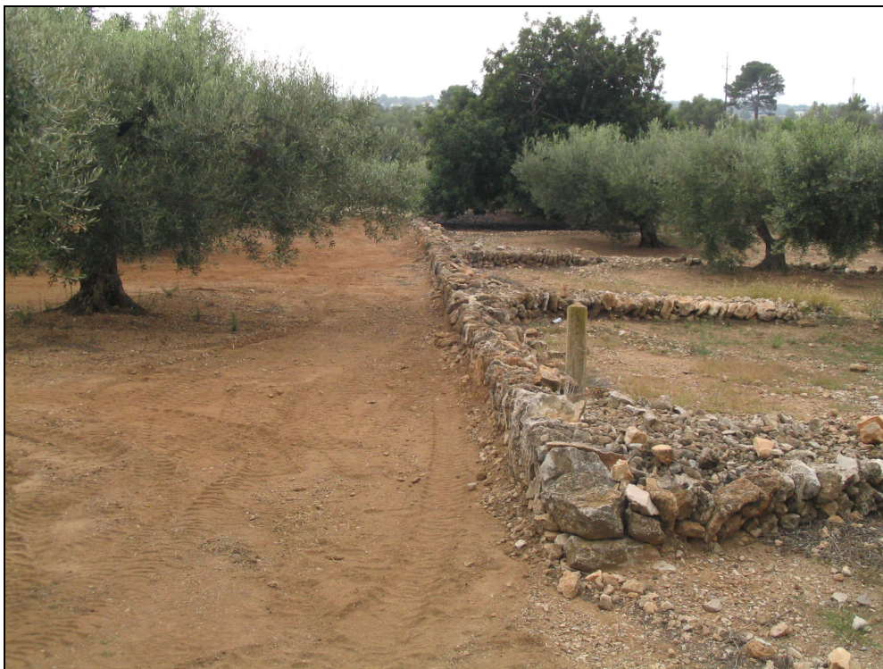
Fotografia 18. Marges de pedra seca i conreu d'olivera a la zona litoral.