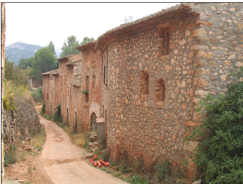
Fotografia 4. Remullà. Tipologia de nucli arquitectònic típic del terme amb gran interès turístic, cultural i arquitectònic. Caldria prioritzar les actuacions de recuperació d'aquests indrets.