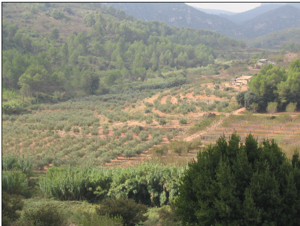
Fotografia 5. Conreus d'oliveres i ametllers i recuperació del bosc al barranc de Remullà, amb cobertures de brolles i pins.