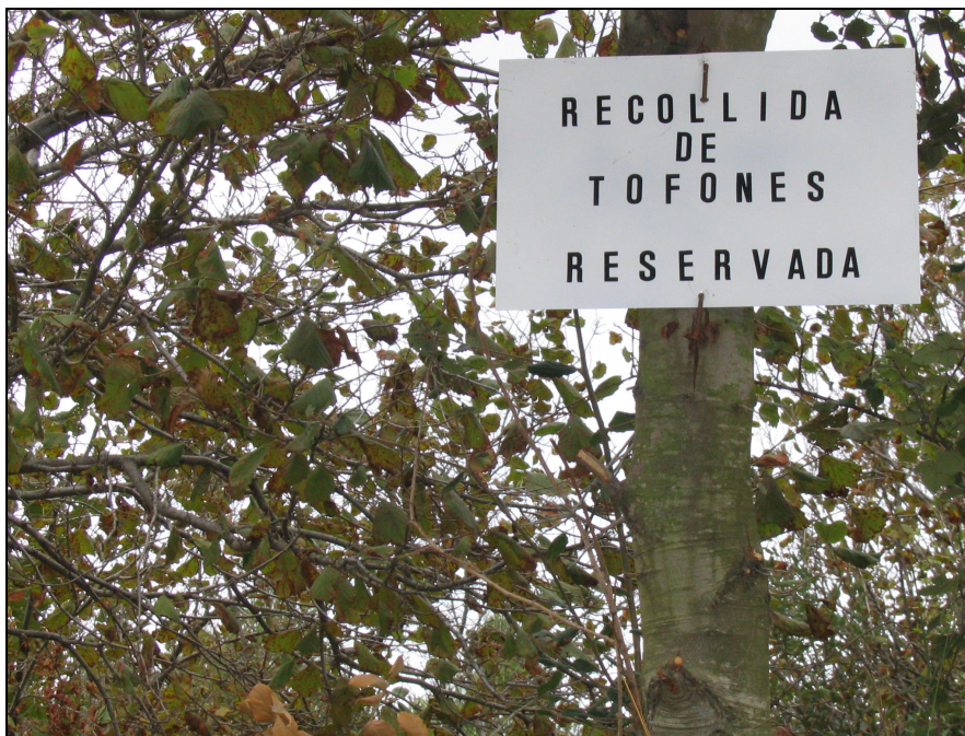
Fotografia 27. Cal afavorir l'aprofitament de totes les externalitats de les zones forestals, com la recollida de tòfones.