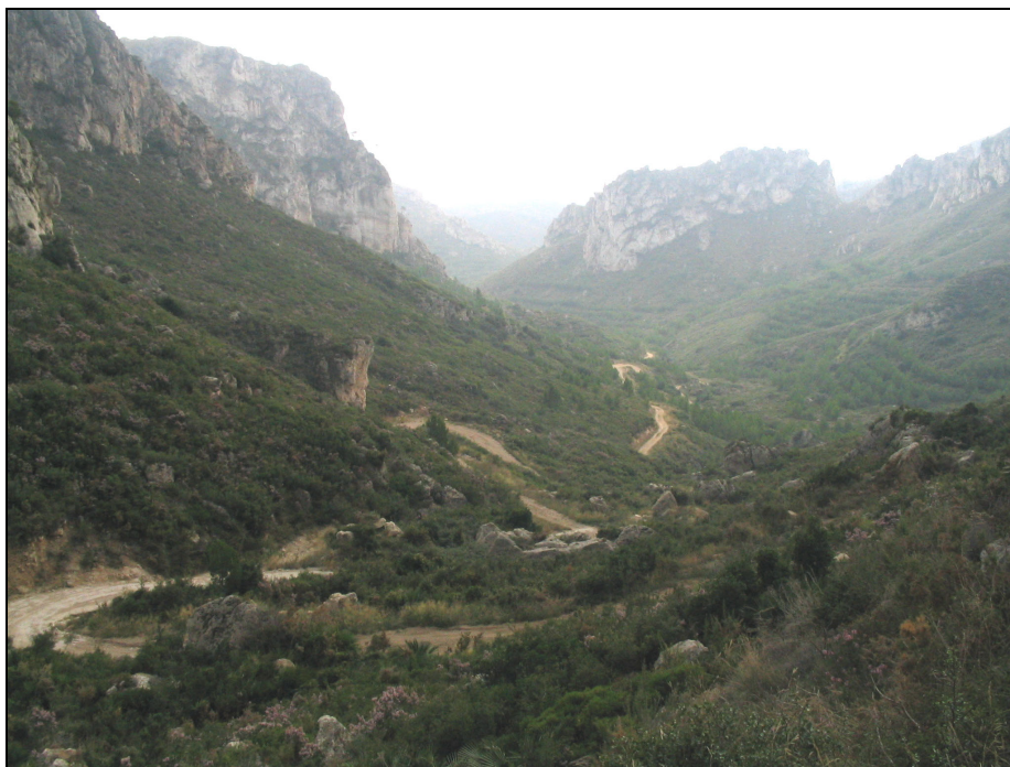
Fotografia 23. Pista forestal al barranc de Lleriola. Existeix una bona dotació d'infraestructures contra incendis.