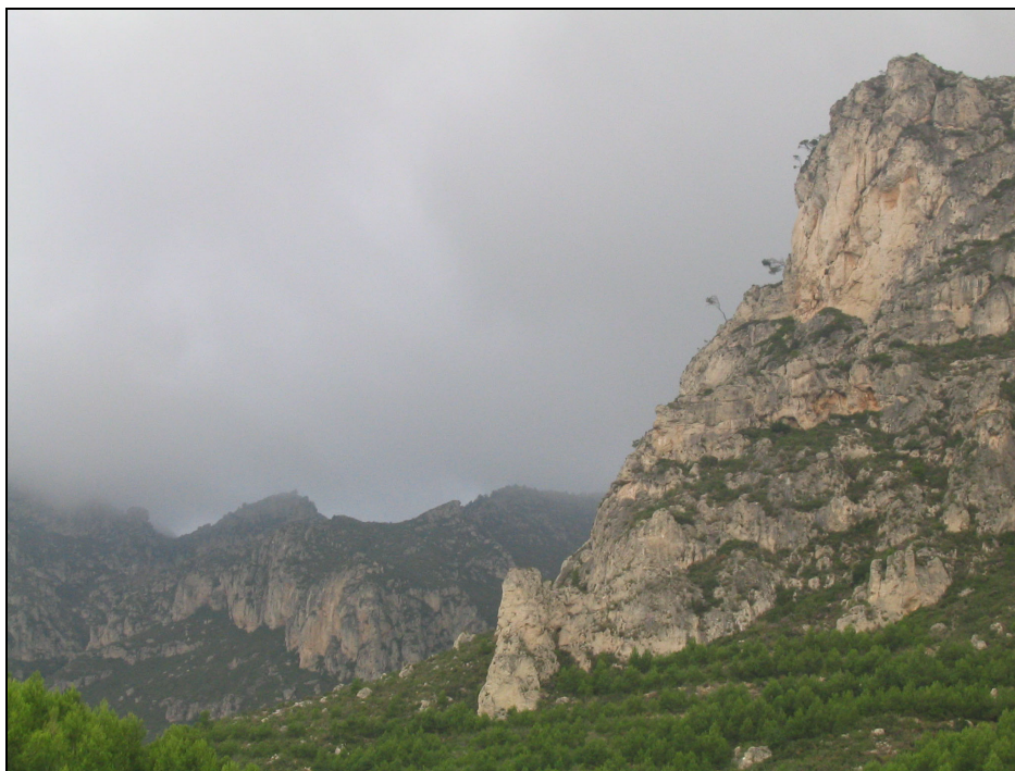
Fotografia 21. Barranc de Lleriola. El medi rupícola, abundant a molts indrets, manté poblacions botàniques i faunístiques de gran interès.