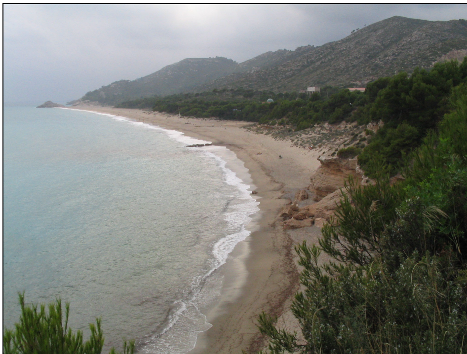
Fotografia 30. Espai d'Interès Natural del Torn-les Rojales. Cal preservar totes les zones litorals no urbanitzades.