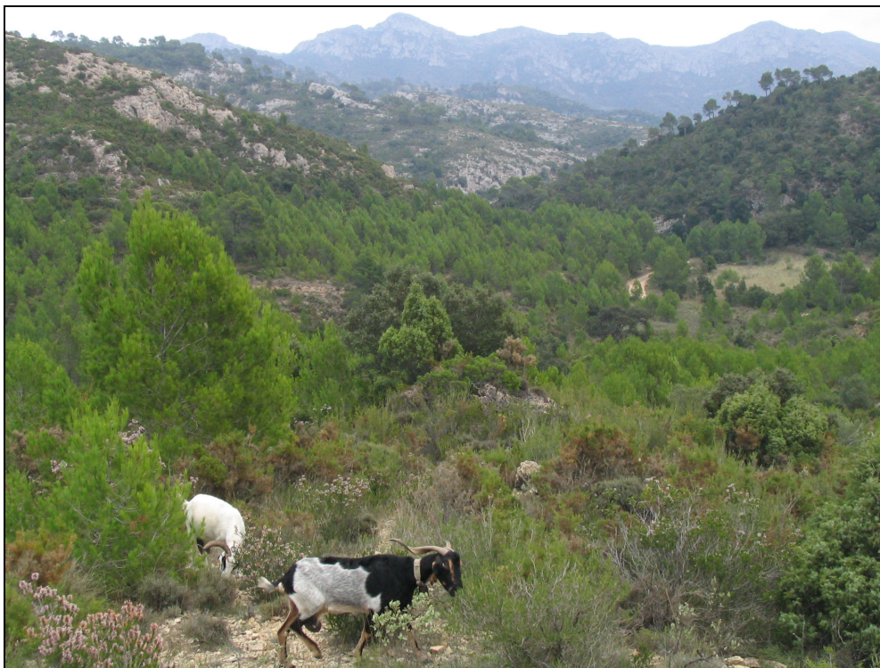
Fotografia 14. Ramaderia de cabrum a les Moles del Taix. Aquesta activitat encara conserva un pes important al terme i representa un factor modelador del paisatge en determinats indrets.