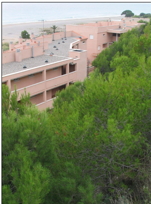
Fotografia 31. Zones urbanitzades amb risc per les persones en cas d'incendi forestal, a la platja de l'arenal.