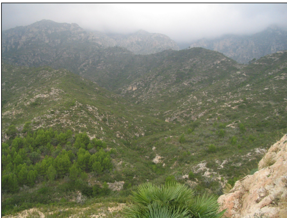
Fotografia 17. Vista de la serra de l'Esteve des dels Acampadors. Zones arbustives amb un grau de naturalitat i aïllament destacables.