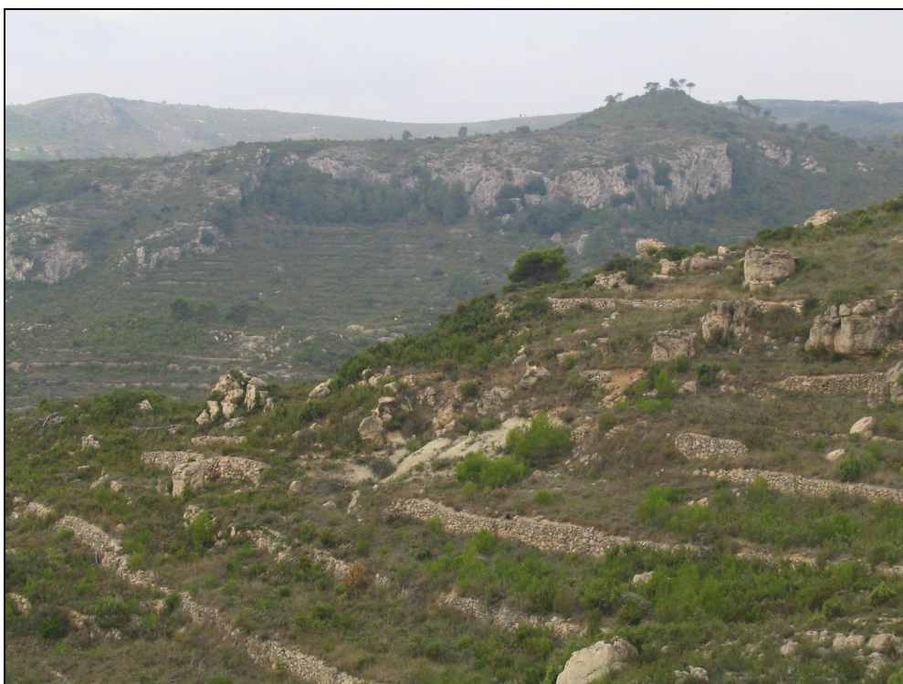
Fotografia 9. Les terrasses amb marges indicadores d'antics conreus abandonats, apareixen arreu de les valls interiors del terme municipal.