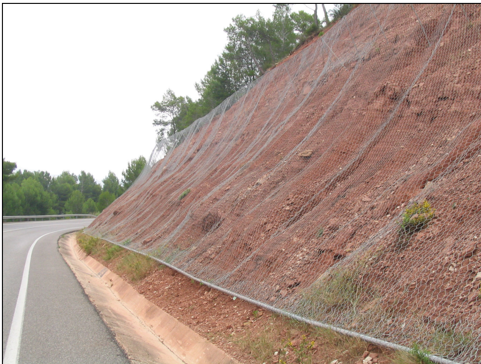
Fotografia 1. Xarxa protectora d'esllavissaments en un talús de la carretera C-233.