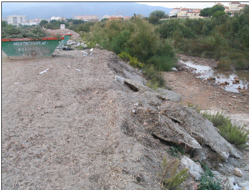
Fotografia 34. Impacte dels abocaments a la desembocadura del riu Llastres, zona humida i amb espècies de flora i fauna de gran valor natural.