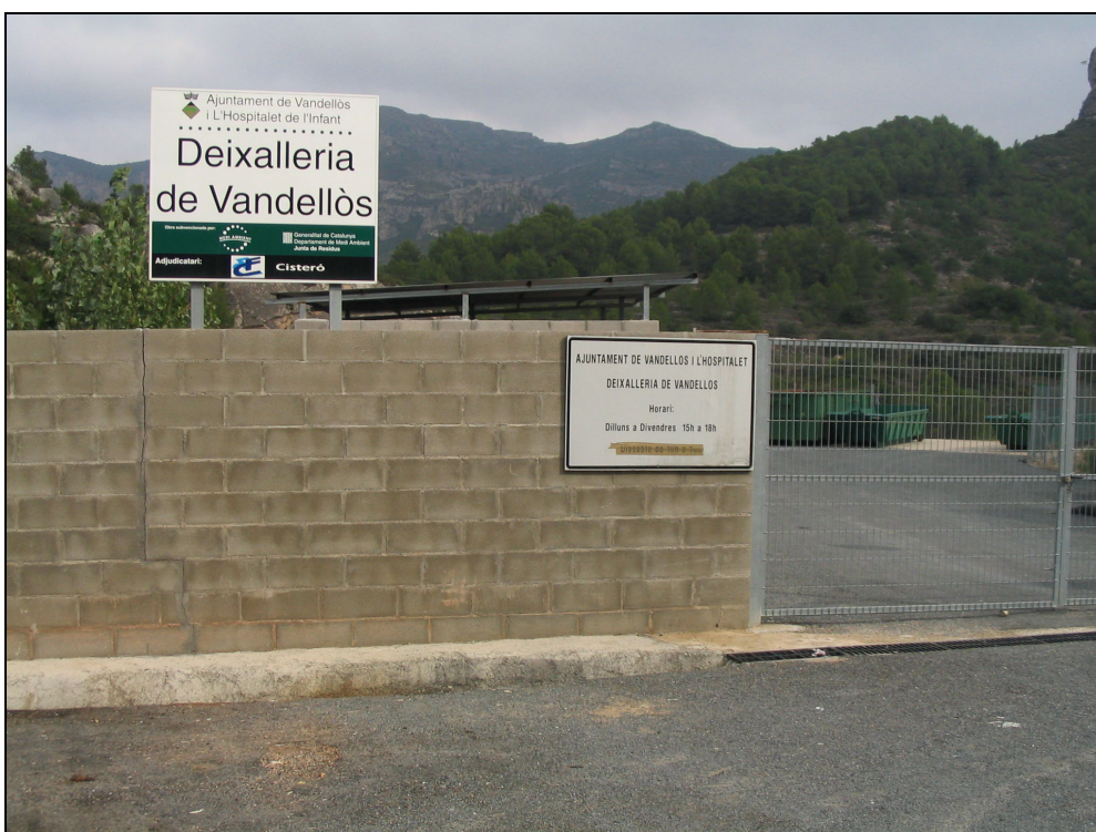
Fotografia 2. Deixalleria de Vandellòs.