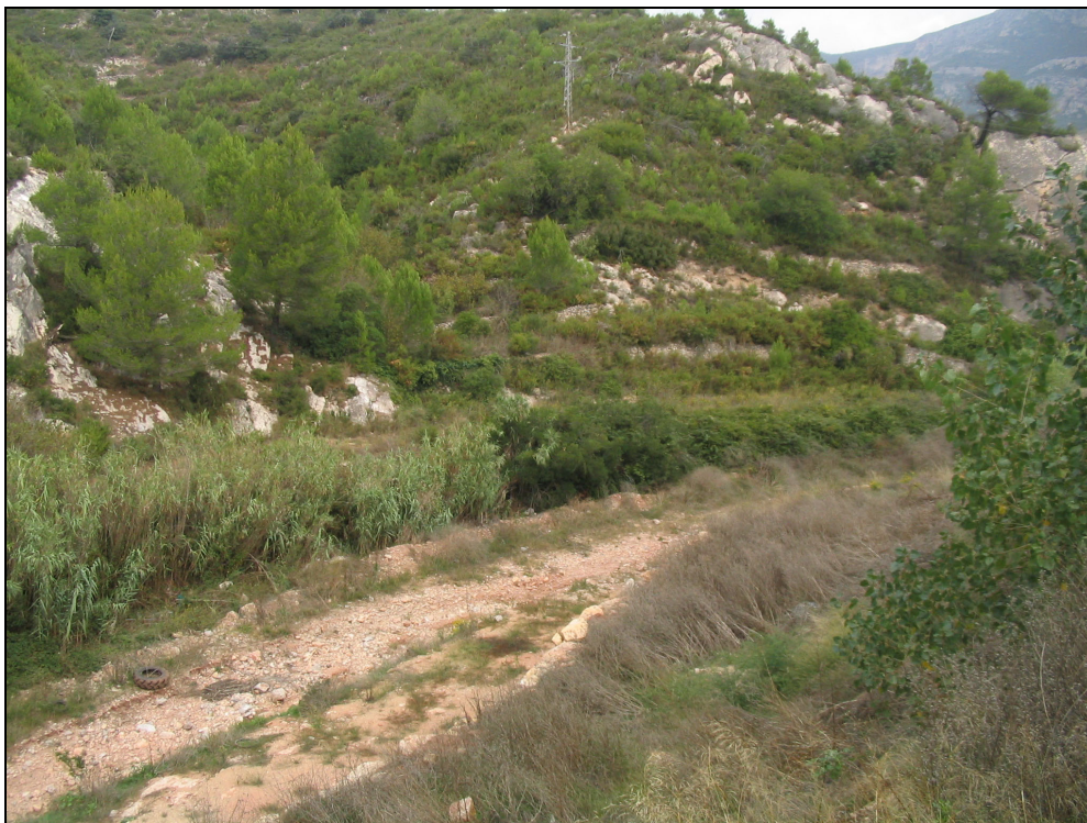
Fotografia 3. Barranc de Burrià, envaït pel canyar ( Arundo donax ).