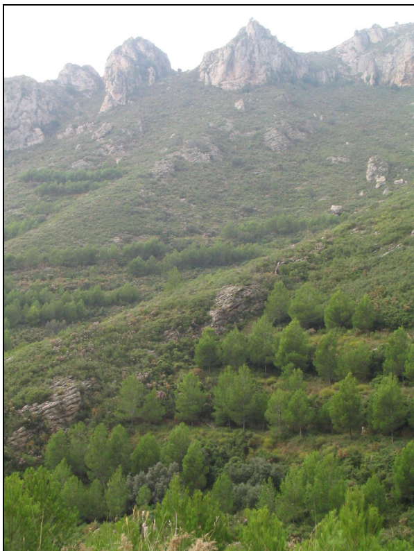
Fotografia 22. Repoblacions amb pi blanc ( Pinus halepensis ) al barranc de Lleriola.