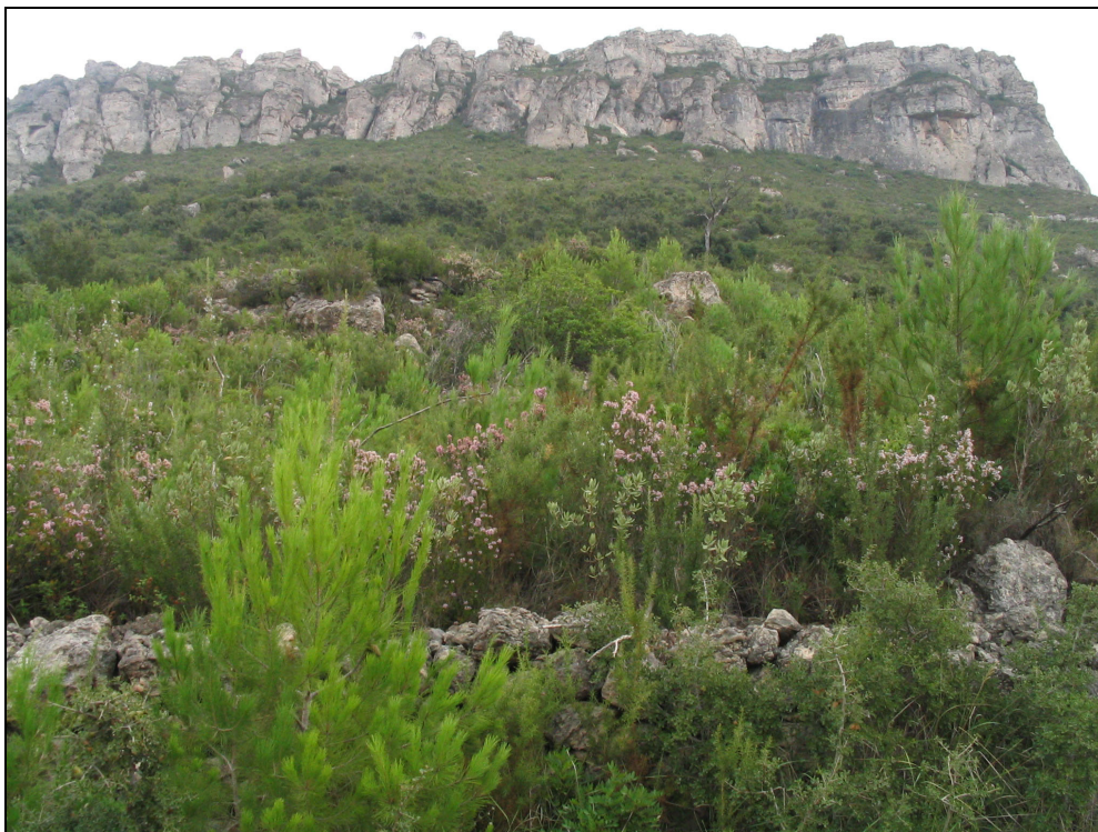
Fotografia 8. Brolla de romani i bruc d'hivern amb pins a la serra de Santa Marina.