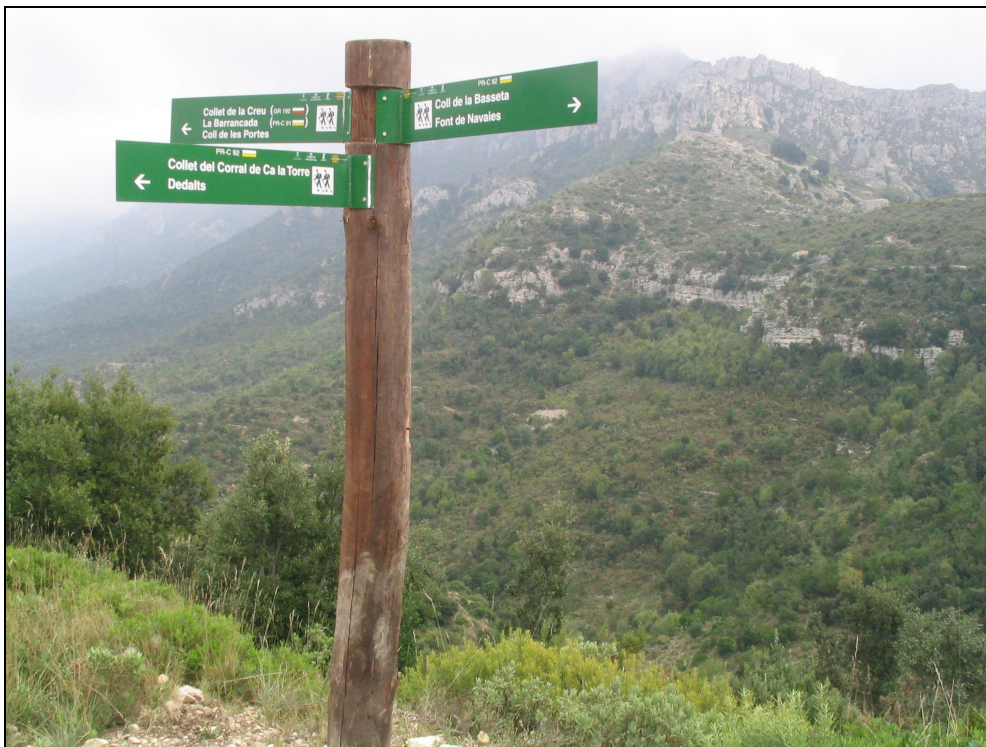
Fotografia 24. Senyalització de senders. Cal potenciar totes les activitats relacionades amb el turisme cultural i natural.