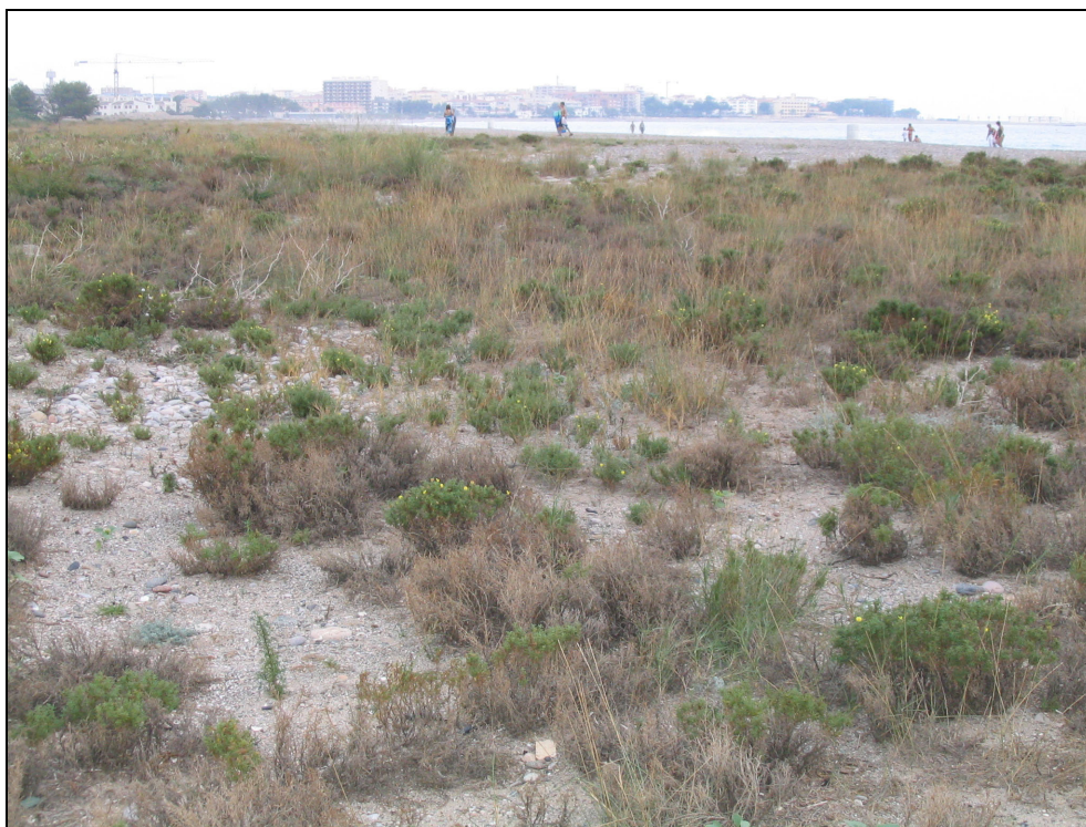
Fotografia 32. Vegetació de reraduna a la platja de l'arena. Cal mantenir la naturalitat de les platges com element distintiu de qualitat ambiental.