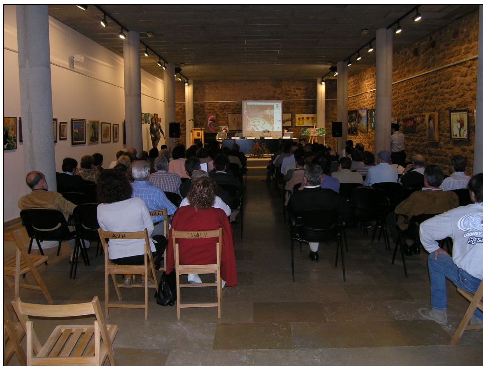
Fotografia 35. Fòrum de presentació de l'Agenda 21. Sala Infant Pere. L'Hospitalet de l'Infant.