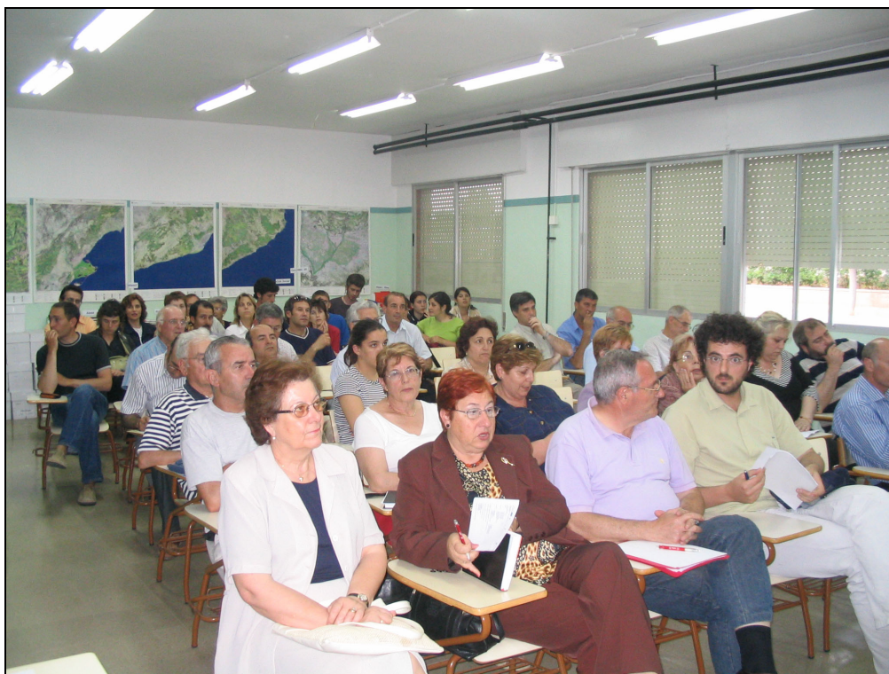
Fotografia 37. Acte de presentació dels Tallers de Diagnosi.