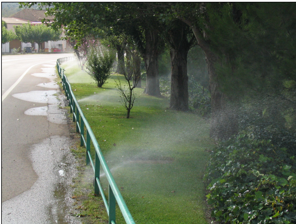
Fotografia 12. Jardins al nucli de Vandellòs. La utilització d'espècies al·loctones i amb necessitats elevades d'aigua suposa un malbaratament del recurs hídric.