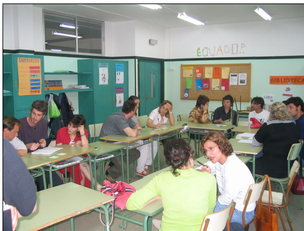
Fotografia 38. Tallers de Diagnosi. Grup dels agents Tècnics.