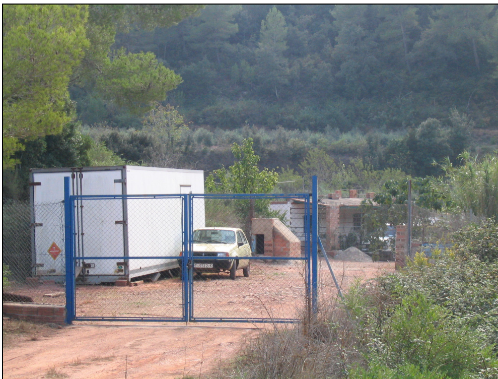
Fotografia 13. Parcel·la amb construccions no integrades a l'entorn.