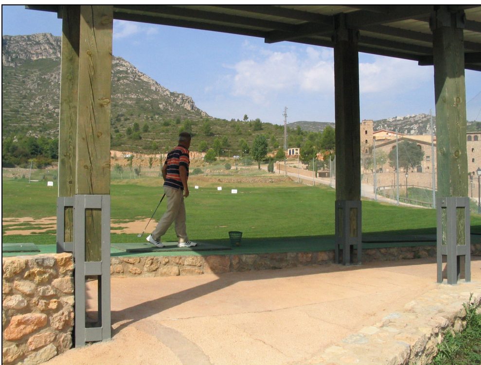
Fotografia 11. Activitats de turisme associades a la recuperació de masies de la zona d'interior. Les activitats relacionades amb el golf poden representar un consum hídic elevat.