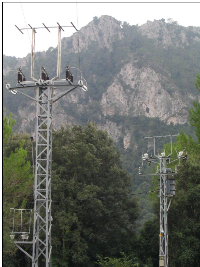
Fotografia 26. Salvaocells instal·lats en torres elèctriques de mitja tensió a l'obaga de Vandellòs.