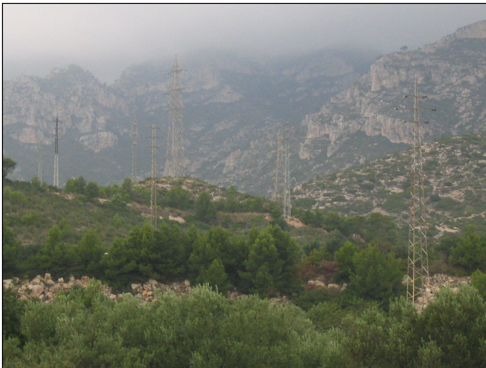
Fotografia 16. Impacte paisatgístic de les línies elèctriques d'alta tensió al coll de Balaguer.