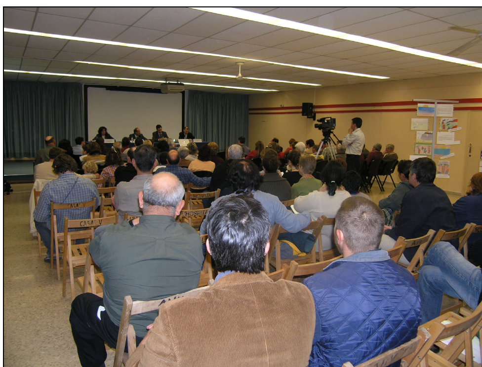
Fotografia 36. Fòrum de presentació de l'Agenda 21. Sala Polivalent. Vandellòs.