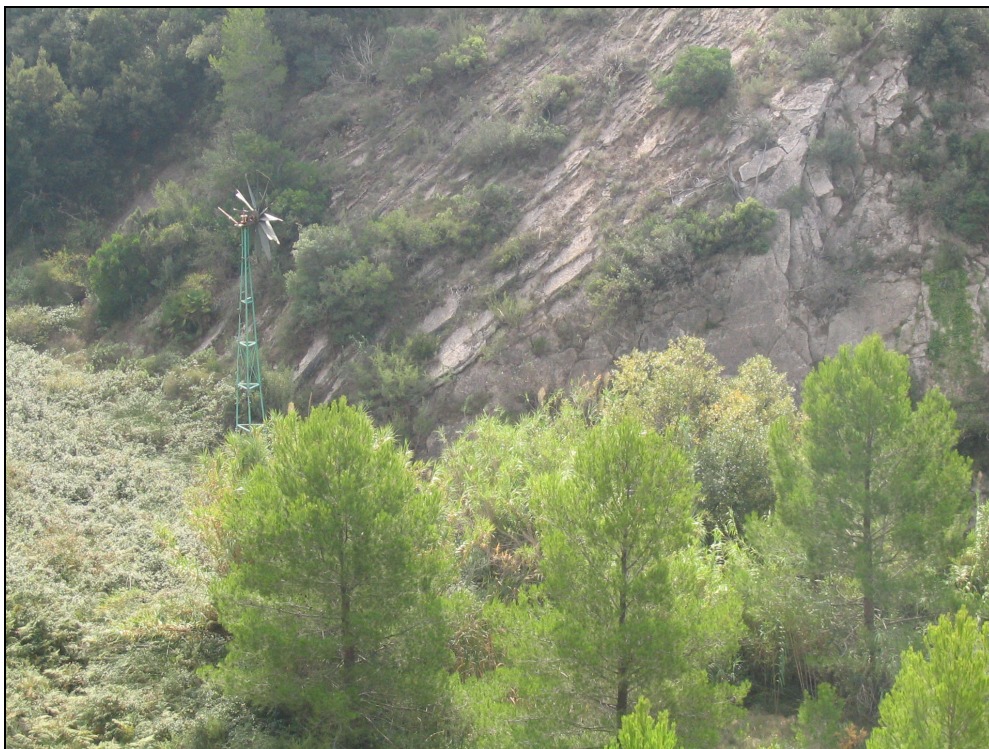
Fotografia 10. Molí de vent i vegetació relictual de ribera al barranc de Remullà.