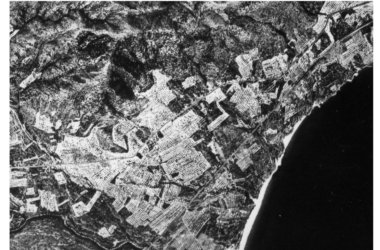
vol americà de 1956