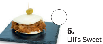
5. Lilí's Sweet