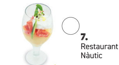
7. Restaurant Nàutic