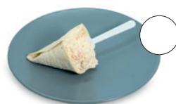
6. Bar-Gelateria La Jijonenca