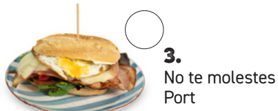
3. No te molestes Port