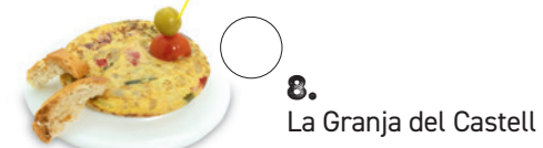
8. La Granja del Castell